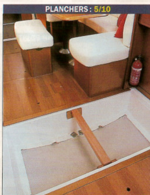
PLANCHERS : 5/10

La disposition longitudinale de la cuisine est commune à tous les croiseurs destinés à la croisière en famille. Difficile en mer, mais conviviale à l'arrêt, cette cuisine dispose de volumineux rangements. Au premier plan, en bas, le réfrigérateur à porte frontale est en option.