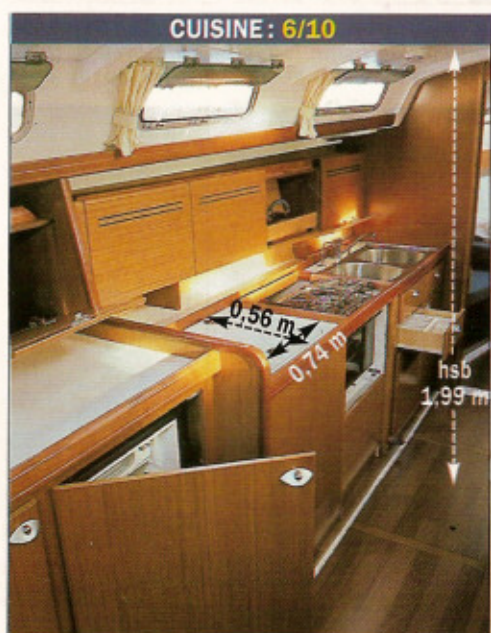
CUISINE : 6/10

style (pas de bois au plafond) et donne un intérieur moins compassé... Mais pas d'ébénisterie figlée ! La banquette centrale se déplace pour libérer le passage vers l'avant. A droite, la table à cartes dispose d'un siège confortable.