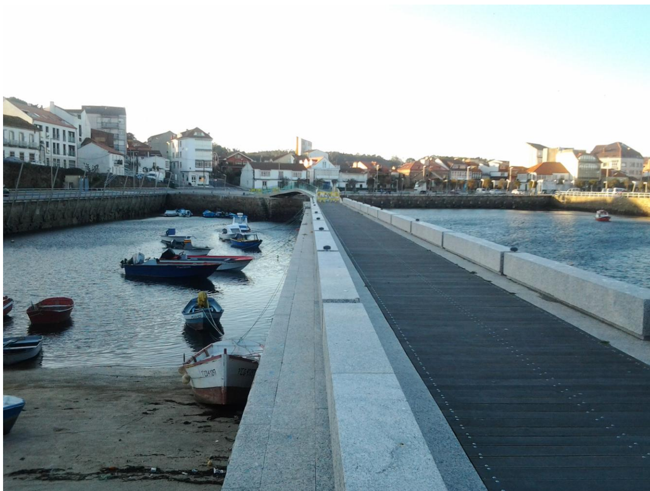
Le môle séparant les deux bassins « pêche ».